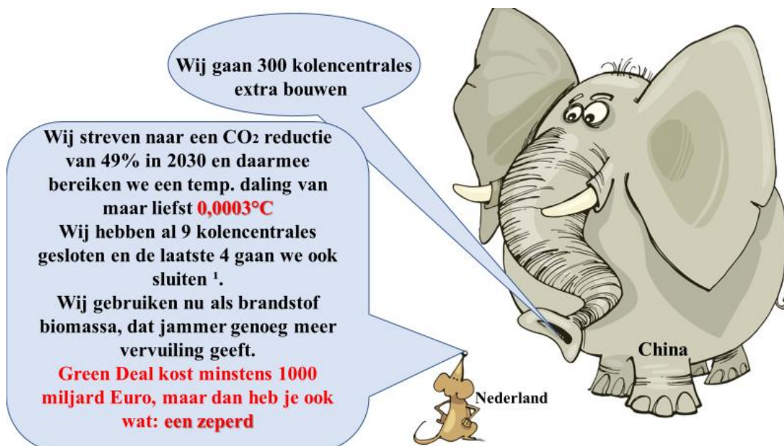
Afbeelding: Ap Cloosterman (2020)

(in onderstaande afbeelding staat nog 49% i.p.v.de vernieuwde 55%)