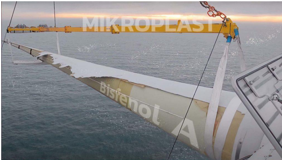
Gebroken / versleten windturbineblad, offshore wind, in vervanging.

Stoffen als Bisfenol A en soortgelijke stoffen brengen zeer grote schade toe aan de voortplanting van de meeste organismen en bij ons mensen.