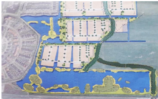
Figuur 2; idee bewoners Obdam