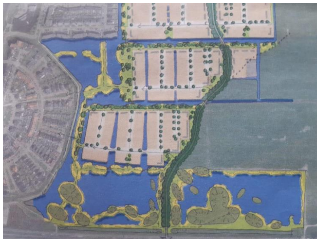
Figuur 3; idee Gemeente Koggenland