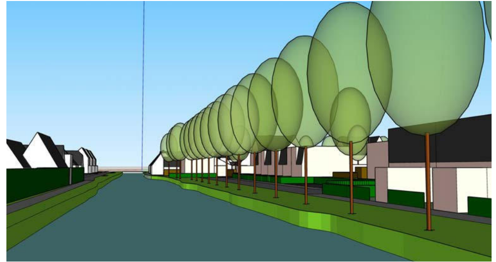
straatbeeld van de fietsbrug over Veersloot