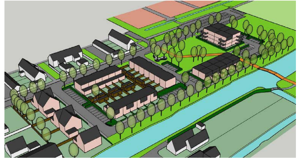
vogelvlucht vanuit zuidoosten