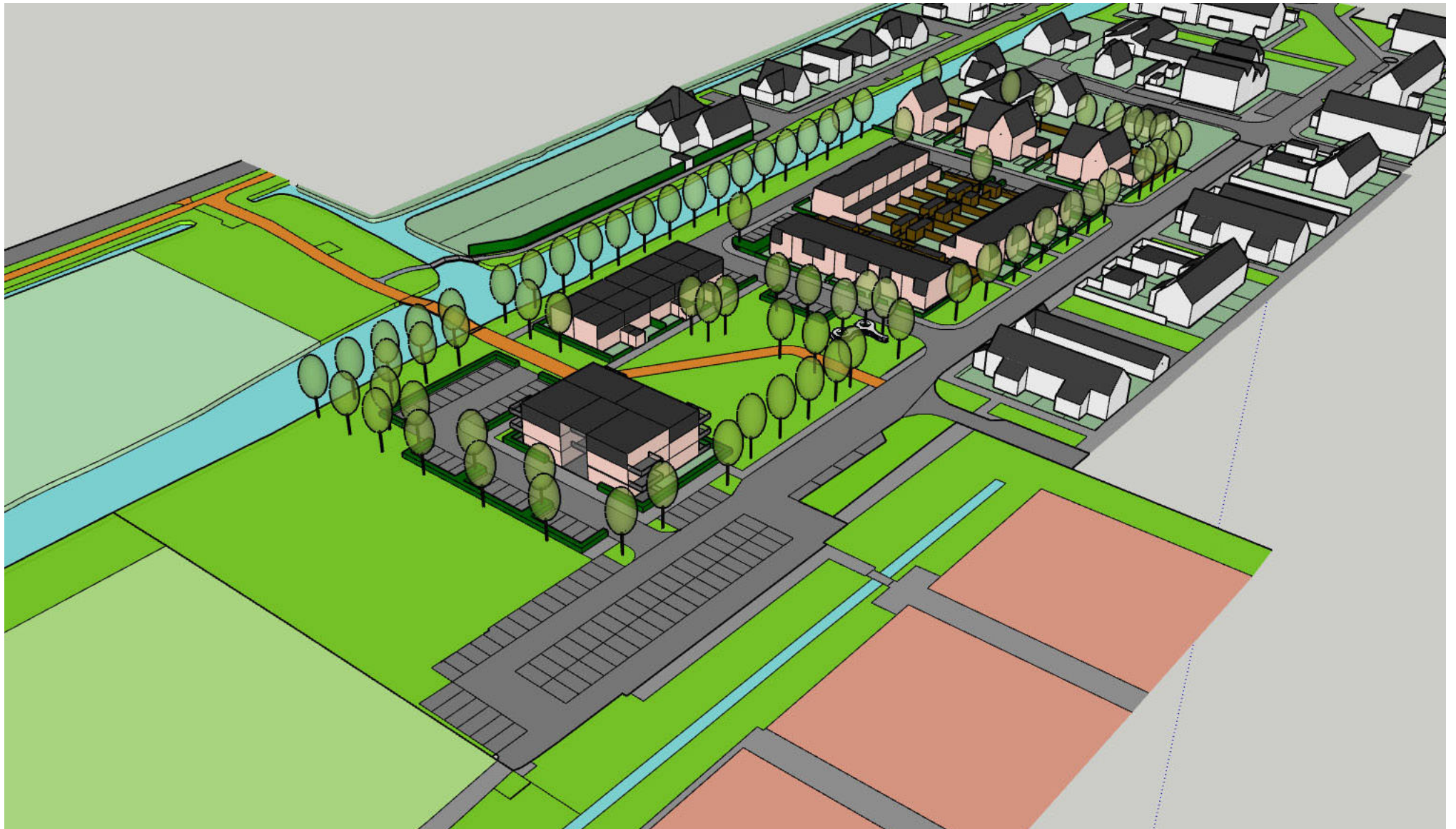
vogelvlucht vanuit noordwesten