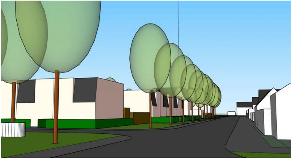
straatbeeld Het Veer vanuit het noorden