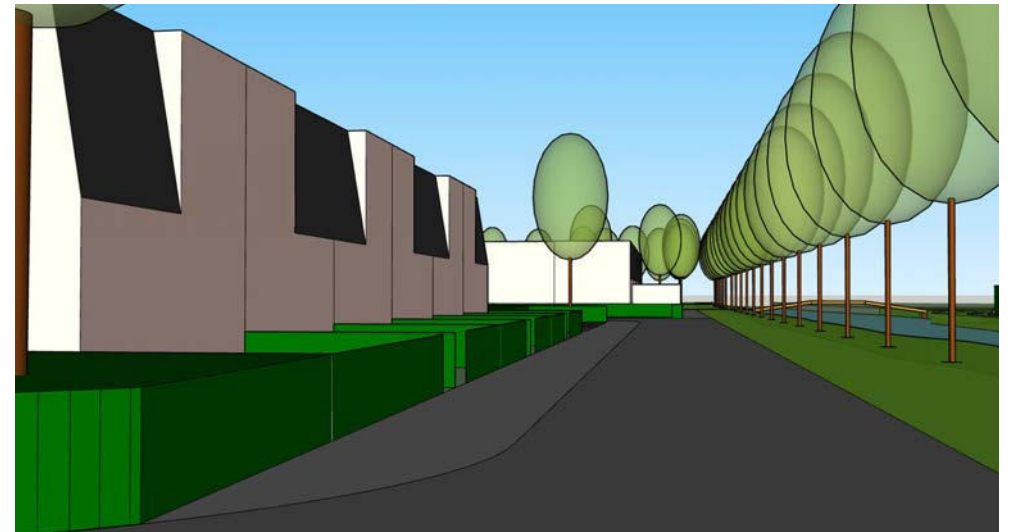
straatbeeld kade Veersloot vanuit het zuiden