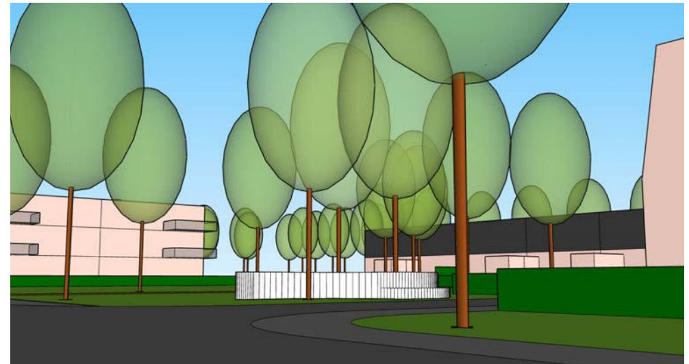
zicht centrale groene plek vanaf Het Veer