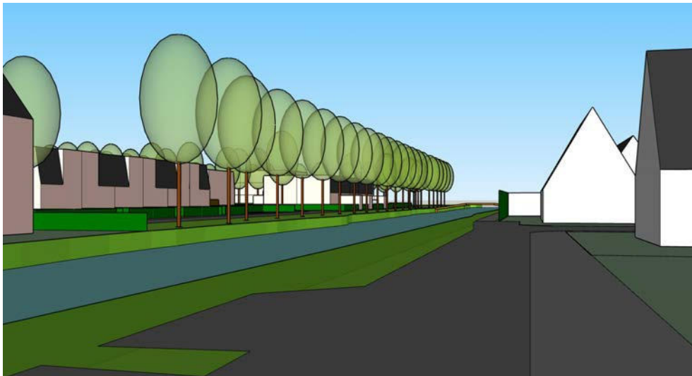
straatbeeld vanaf de Veilingweg