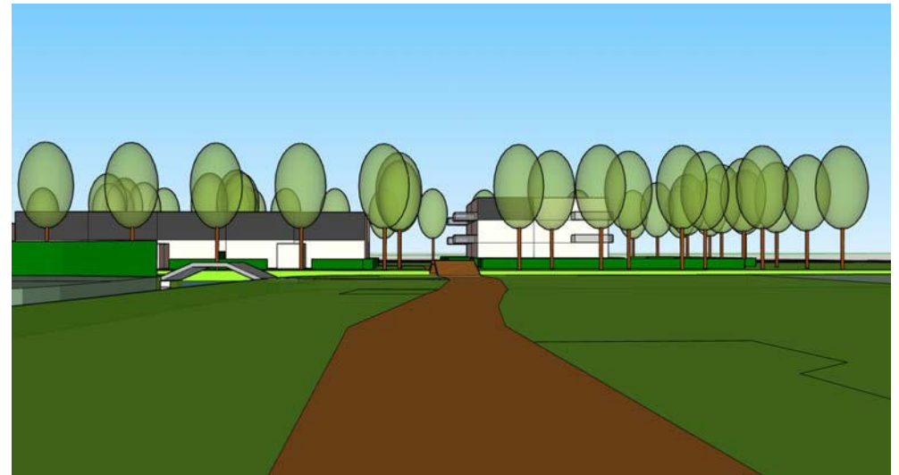
straatbeeld vanaf fietspad bij Provinciale weg