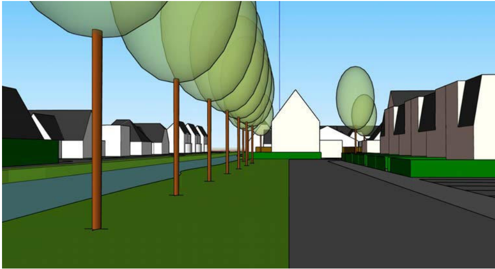
straatbeeld kade Veersloot vanuit het noorden