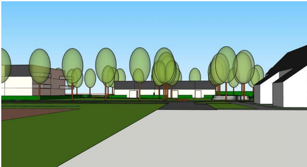
zicht centrale groene plek vanaf Het Veer