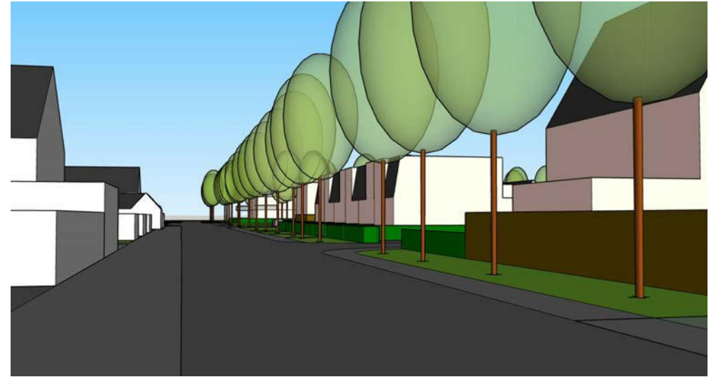
straatbeeld Het Veer vanuit het zuiden