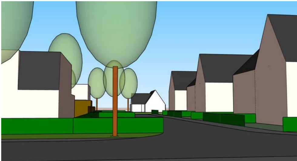
straatbeeld straatje zuidzijde plangebied