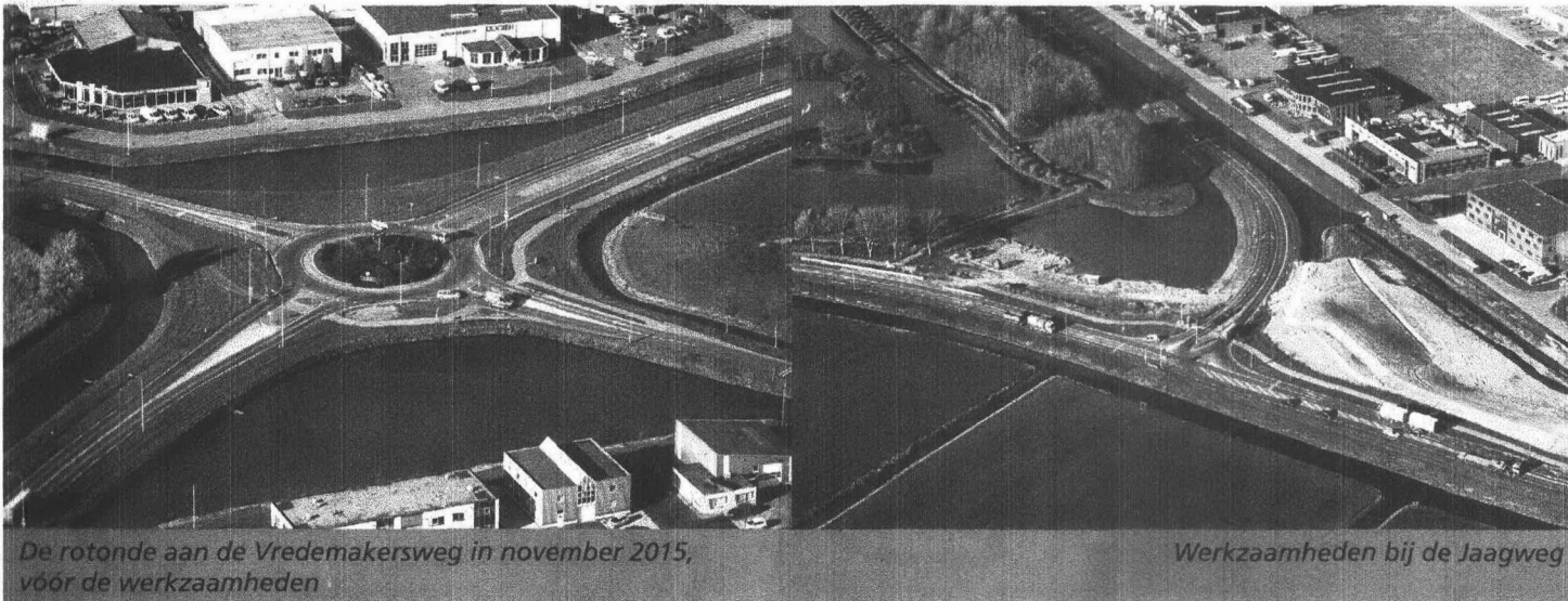
De rotonde aan de Vredemakersweg in november 2015, vóór de werkzaamheden