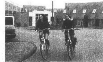
Dienstverlening casemanagers dichtbij, integraal en flexibel p.3