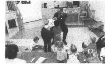
Burgemeester en wethouder lezen voor p.3