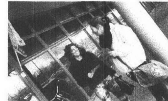
HVC-promotieteam legt uit p.7