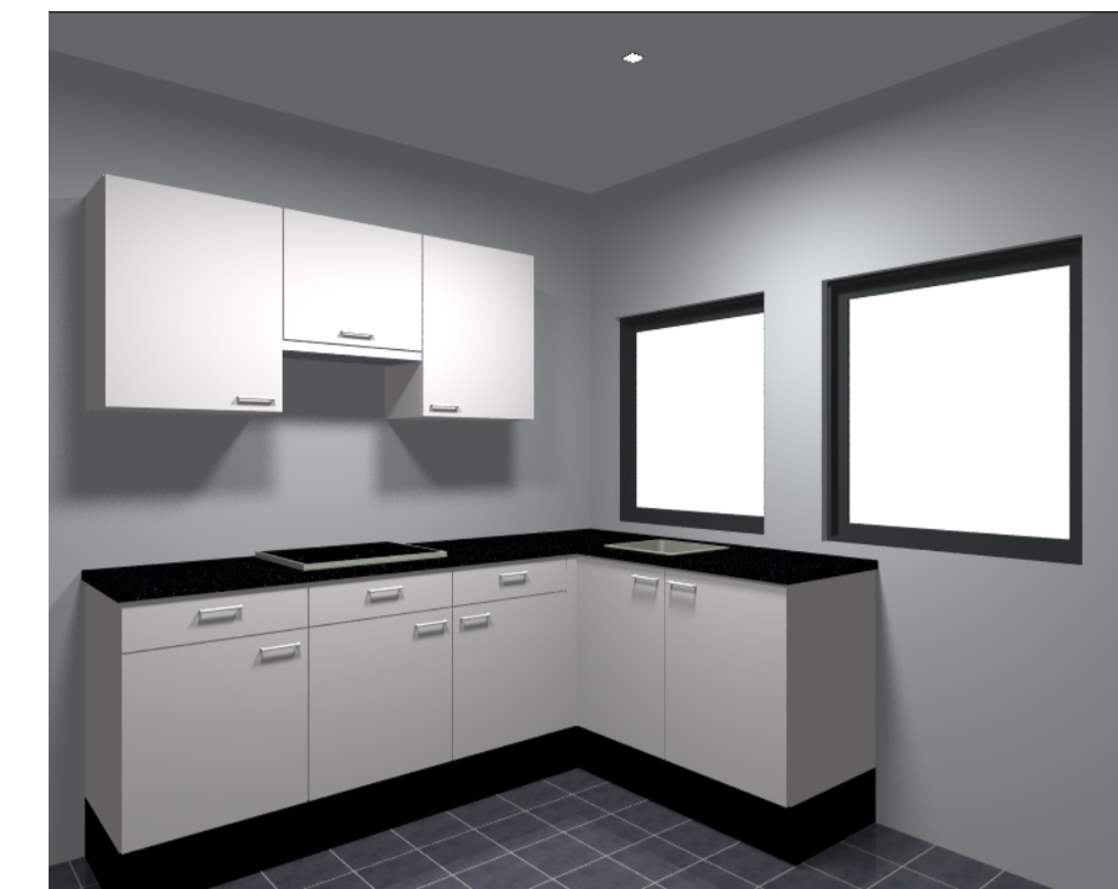
Artiesten impressie van keuken opstelling