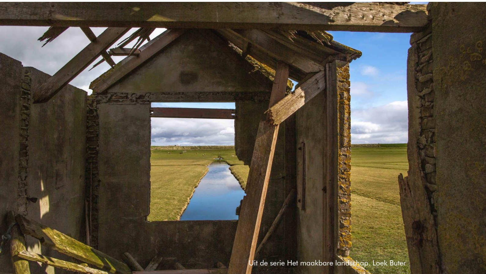
Uit de serie Het maakbare landschap. Loek Buter