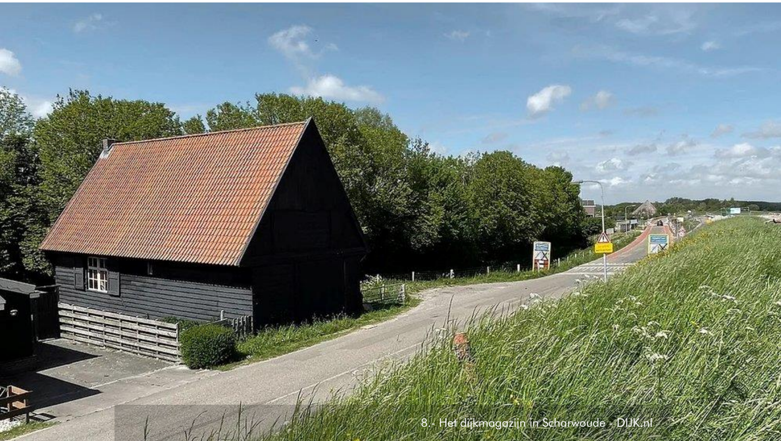
8 - Het dijkmagazijn in Scharwoude