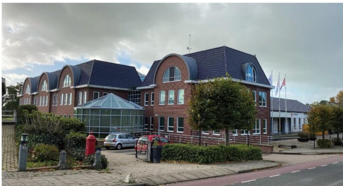
ZICHT VANAF IJSELMEERDIJK