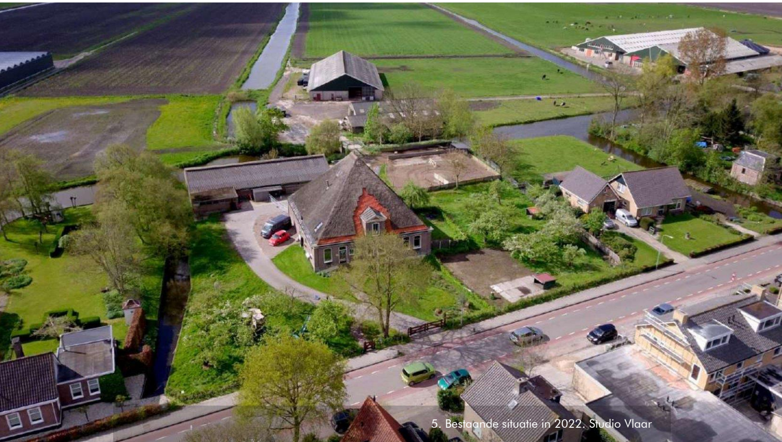
5. Bestaande situatie in 2022. Studio Vlaar