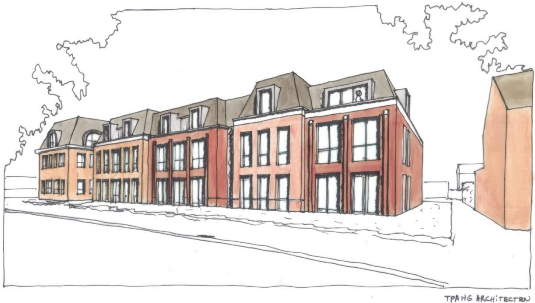
4. Principeontwerp na onderzoek, zijde van de Scharwoude. TPAHG