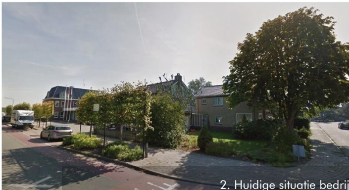
2 WONINGEN OP PLANGEBIED