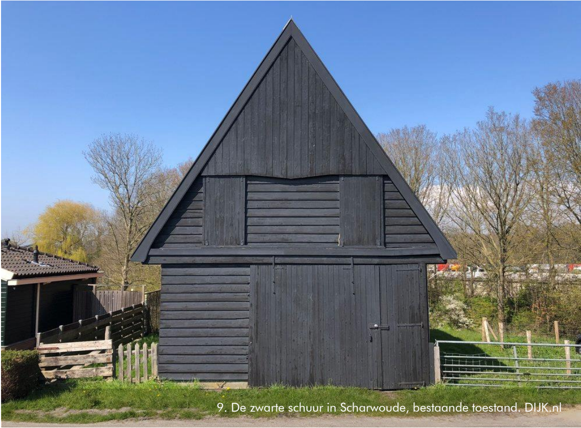
9. De zwarte schuur in Scharwoude, bestaande toestand. DIJK.nl