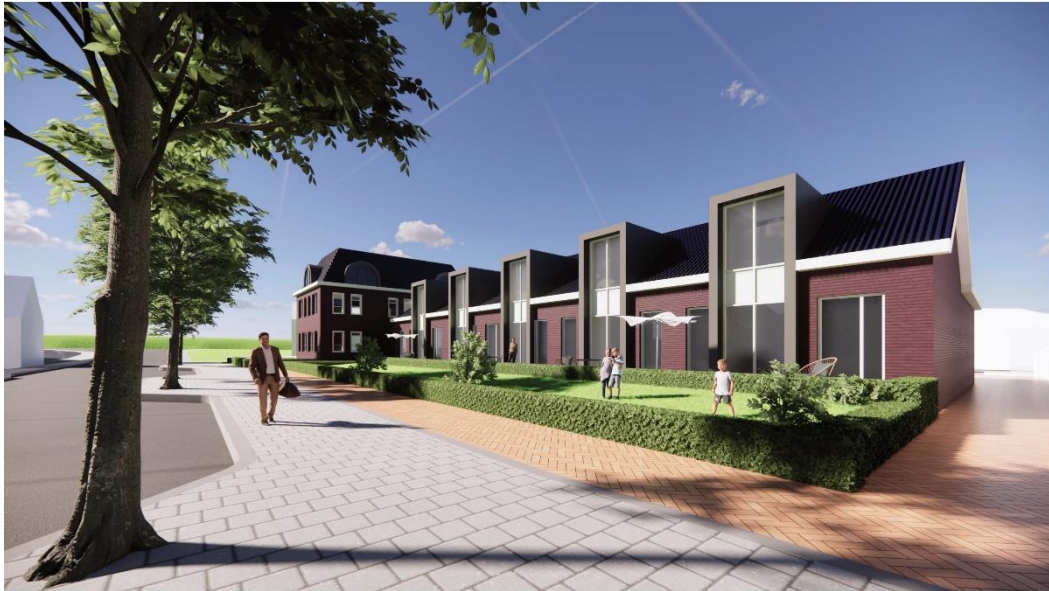
3. Eerste ontwerp voor de nieuwbouw, zijde van de Scharwoude. TPAHG Architecten 16