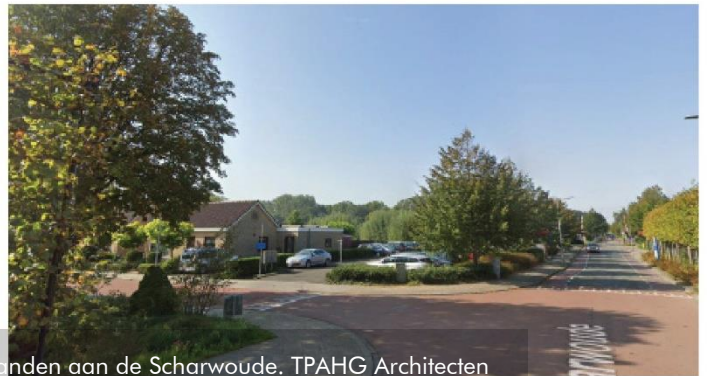
ZICHT OP PARKEERTERRAIN

2. Huidige situatie bedrijfspanden aan de Scharwoude. TPAHG Architecten