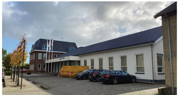
ZICHT VANAF SCHARWOUDE